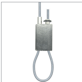
Schlaufenbilder II Tragkraft: max. 20 kg Für Seile: Ø 1,5 - 1,8 mm