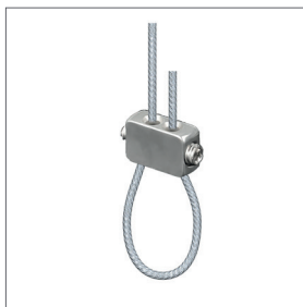
Schlaufenbilder IV Tragkraft: max. 10 kg Für Seile: Ø 1 - 2 mm