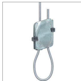
Schlaufenbilder V Tragkraft: max. 15 kg Für Seile: Ø 1,5 - 2 mm