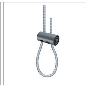
Schlaufenbilder III Tragkraft: max. 1 kg Für Seile: Ø 1 - 2 mm