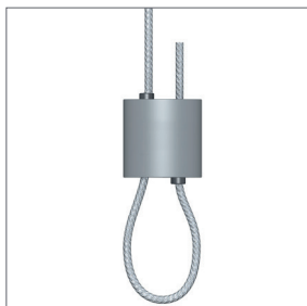
Schlaufenbilder I Tragkraft: max. 10 kg Für Seile: Ø 1 - 1,5 mm